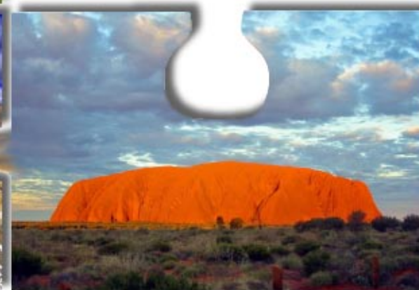
Ayres Rock, Austrálie